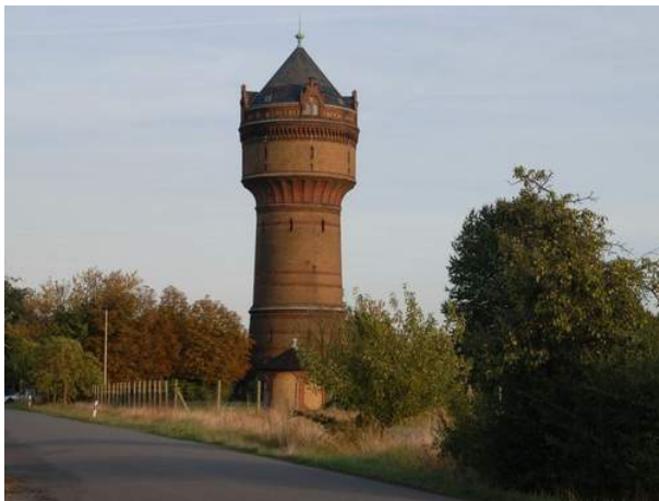
Noch gibt es keinen Zuwendungsbescheid für den Zerbster Wasserturm.

Das Leader-Förderjahr 2017 ist so gut wie rum, doch für den Zerbster Wasserturm gibt es noch keinen Zuwendungsbescheid.