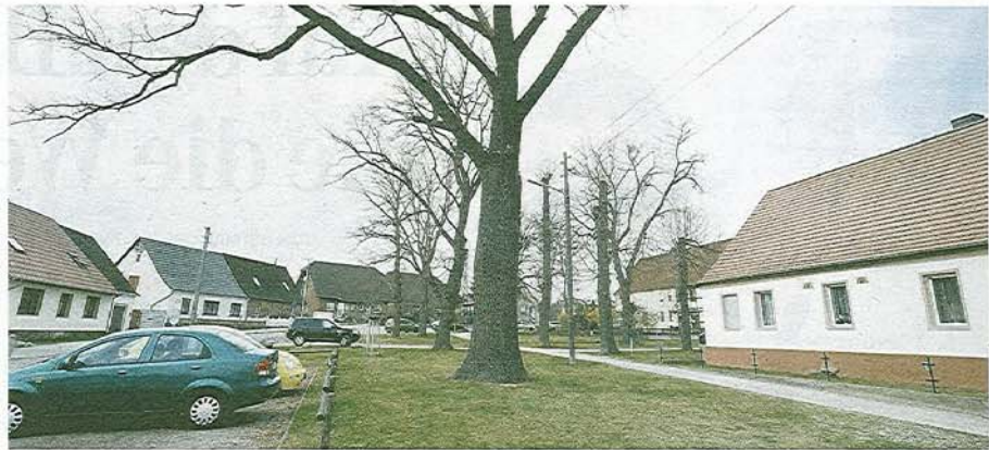
Der Lindenplatz, Festplatz in Meinsdorf, soll aufgewertet werden.

Wann die Arbeiten in diesem Jahr am Lindenplatz beginnen, hängt davon ab, wann die Mittel für die Maßnahme fließen. „Zum Erntedankfest können wir keine Baustelle gebrauchen“, appellierte Ortsbürgermeister Dreibröd. „Bis dahin brauchen wir wenigstens den Verteiler.“