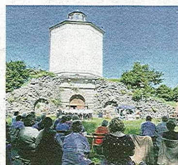
Am Fuße des Napoleonsturms soll ein Rastplatz entstehen.