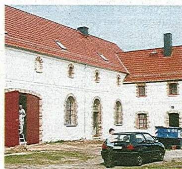
In Garitz zieht in den Kulturkomplex ein Laden ein.