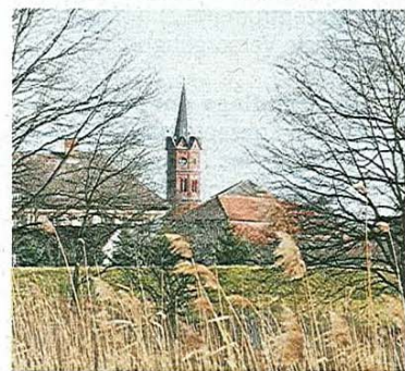
Das Kirchenumfeld in Großkühnau soll gestaltet werden.

Weitere Informationen zur Leader-Region und der Aktionsgruppe unter www.mittlere-elbe-flaeming.de