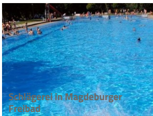
Schwimmer in Magdeburger Freibad