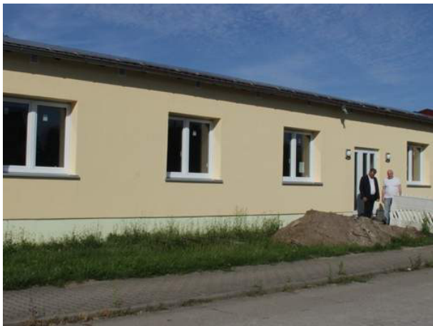
Die Strukturierung des neues multifunktionalen Zentrums zeigt sich auch in der Farbgestaltung: Wohnung, Gemeinde und Bauhof (v. li.) sind farblich unterschiedlich gestaltet .